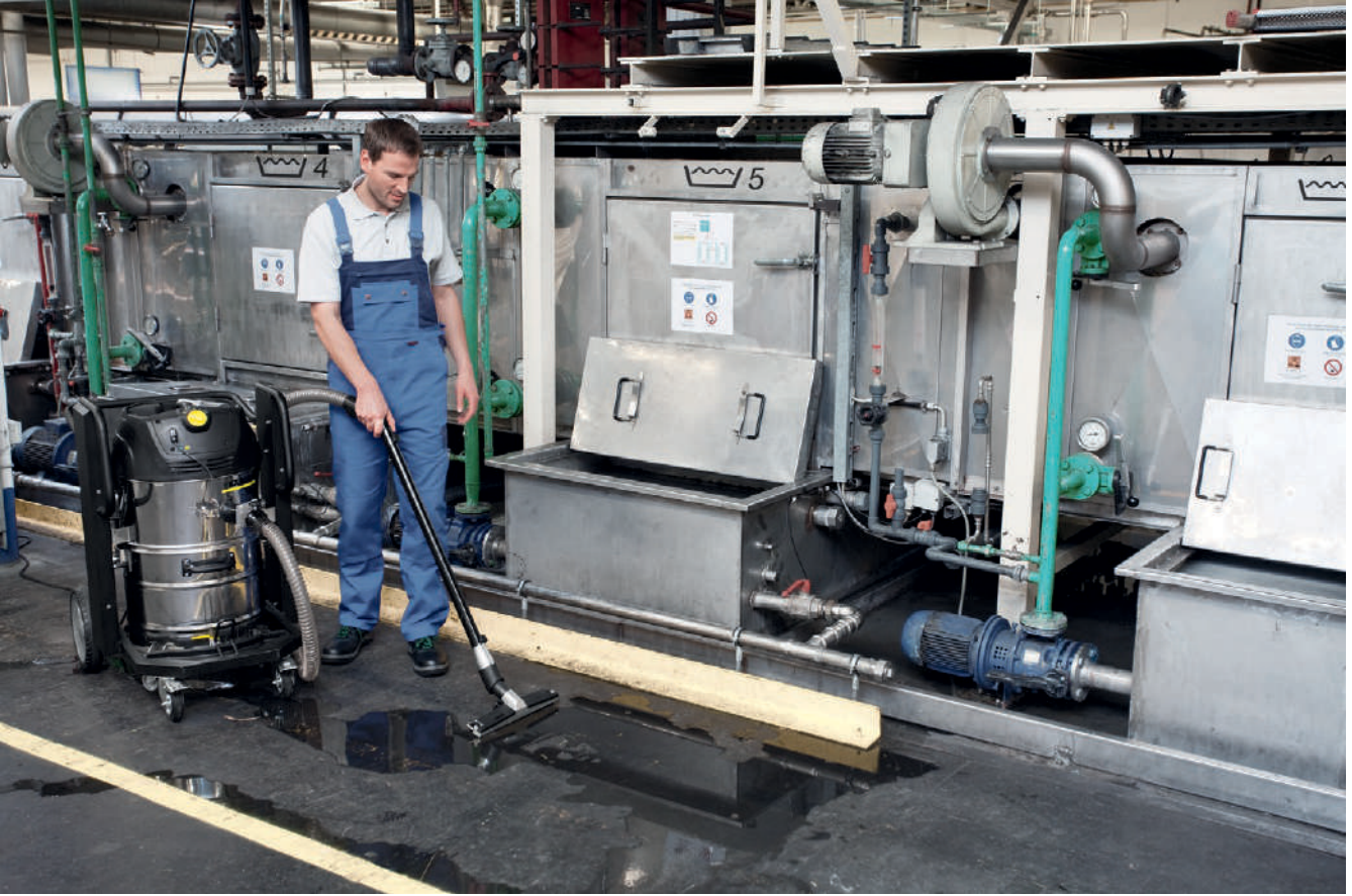
IVC 60/24-2 Tact²